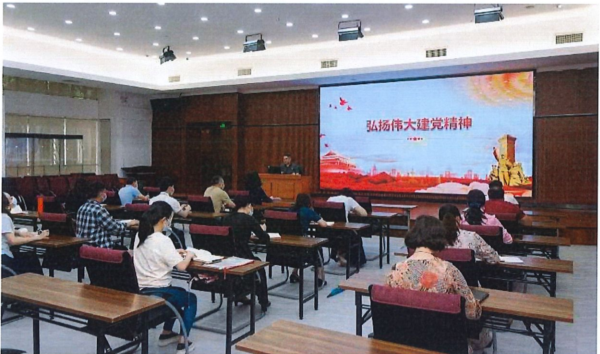
“党史故事大家讲”主题活动现场