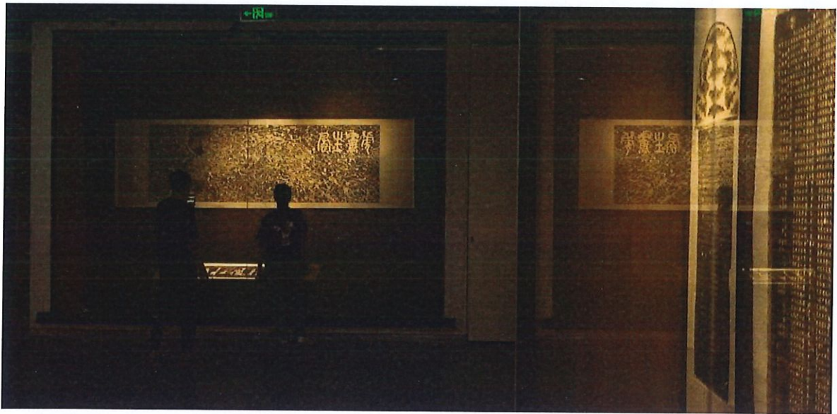
螳川遗风连然古韵——安宁名碑名帖拓片展