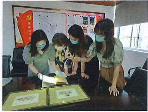
文物征集工作照片