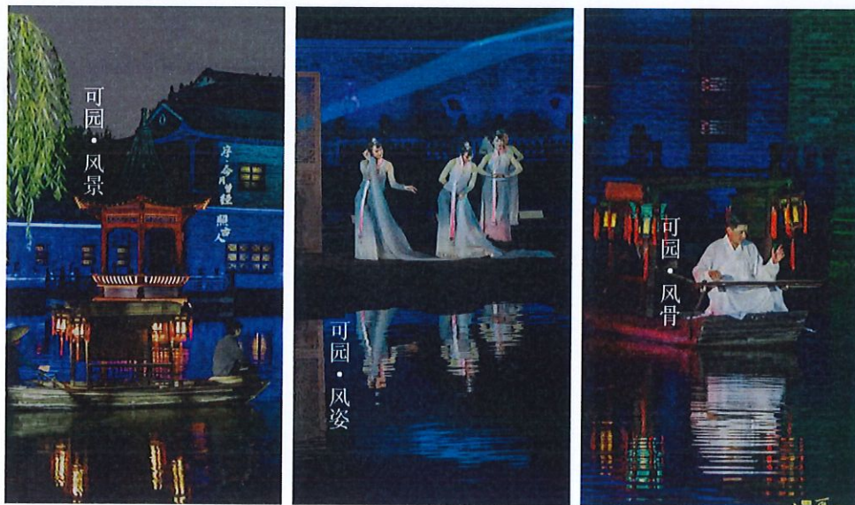
“中秋可园——岭南园林实景秀”现场

9月9日晚，成功举办在可园举办“中秋可园——岭南园林实景秀”，活动以实景演出的方式，还原一场穿越百年的诗画雅集。本次活动巧用“文化+科技”方式，用光影、水雾，打造音视效果，全景式呈现岭南地区丰富多彩的中秋民俗文化活动，在沉浸式的体验中充分展示了莞邑文化的影响力、凝聚力、感召力。据统计，本次演出吸引了超500万海内外网友在线观看，包括人民日报客户端、中视新闻、央广网、文旅中国、凤凰网等10余个媒体平台直播，全球网友共享视听盛宴。