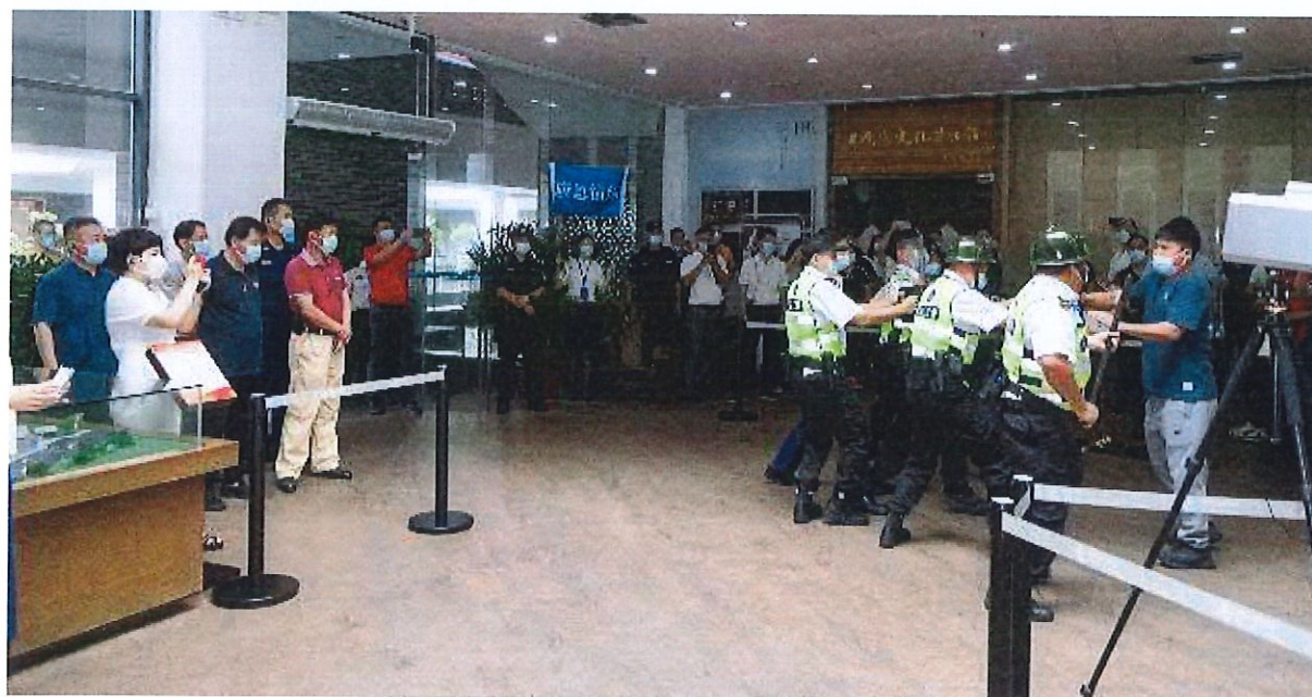
2022 市文化广电旅游体育系统行业安全生产工作暨推进系统行业消防安全 标准化管理工作现场会议