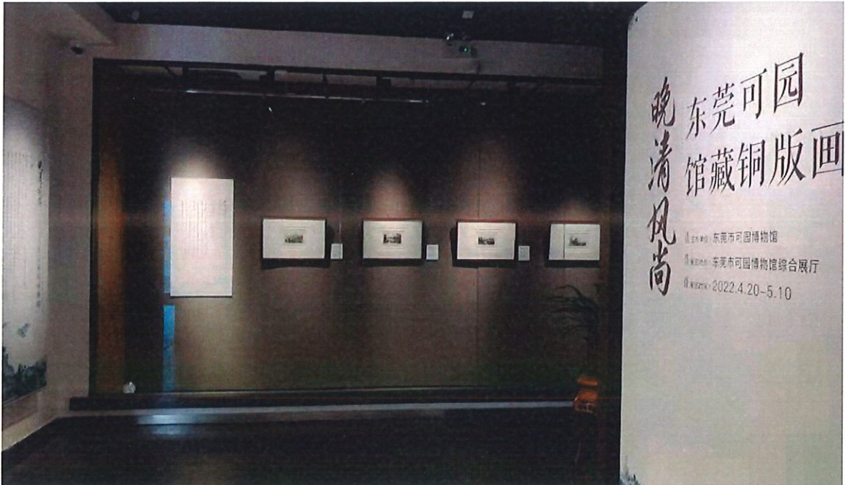
晚清风尚——东莞可园馆藏铜版画展