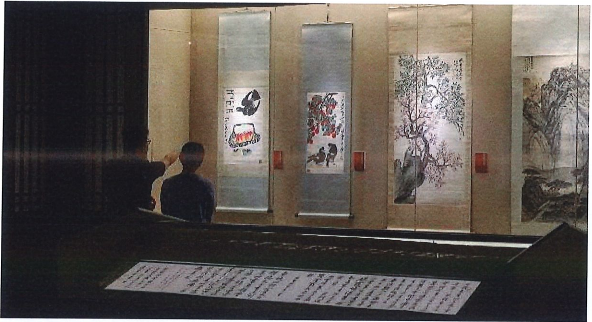
时代标程美在湾区——中国艺术名家精品展