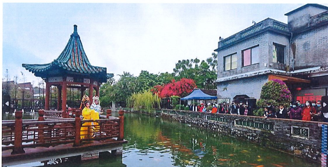
以传统节庆为切入点，丰富市民节日文化生活

随着东莞“文化强市”的推进，博物馆越来越受到社会高度关注与喜爱，“打卡”博物馆成为群众尤其是年轻人最直接的文化体验。9月17日，我馆举办了“去博物馆拍视频——手机摄影公益培训”惠民活动，邀请了东莞人气视频博主担任主讲，以可园为拍摄主角，通过“理论+实践”的方式为学员讲授时下最热门的视频拍摄技巧，用视频记录富有岭南特色的园林美景。以新的形式促进更多的年轻人走进博物馆，深入了解莞邑文化。