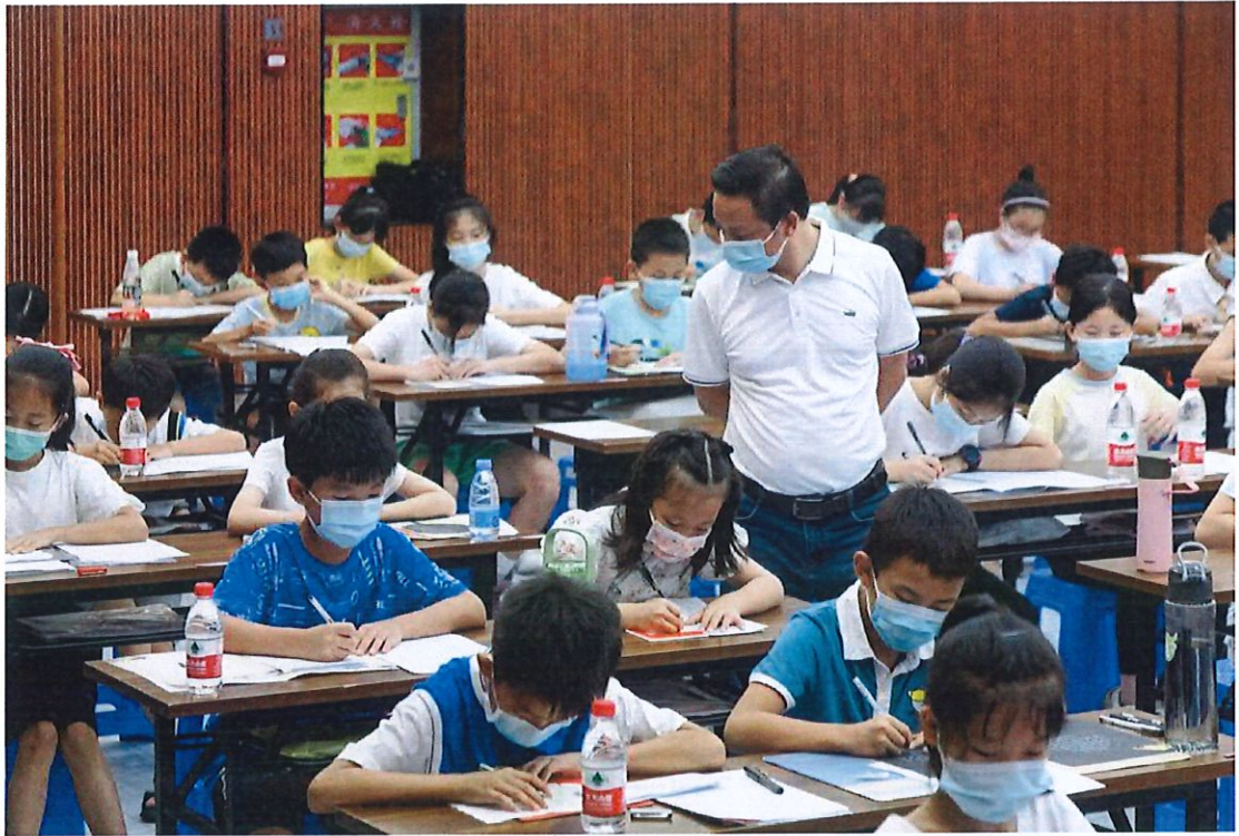
第七届“可园杯”东莞市青少年硬笔书法现场大赛现场