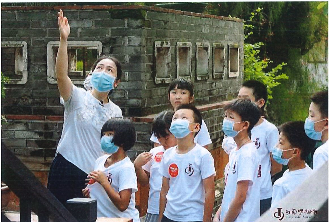
可园小学士夏令营