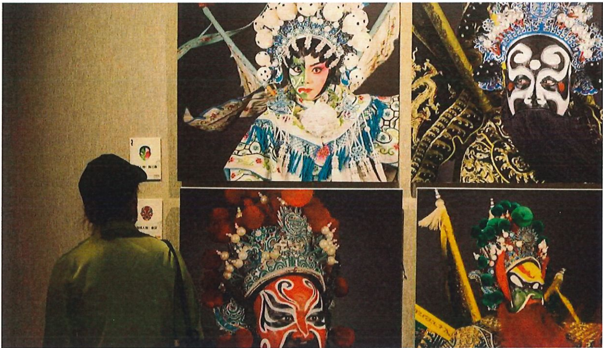
浓墨重彩粤剧花脸艺术影像展